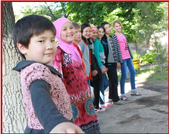
Mei 2016: Kinderen in de shelter van CPC

Ook het aantal straatkinderen is sterk gestegen. De cijfers die de autoriteiten vrijgeven, liegen er niet om. Een greep eruit: