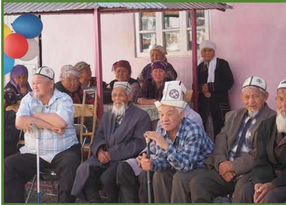
September 2015: Opening gerenoveerd theehuis Batken

De gestegen kosten van levensonderhoud hebben tot gevolg dat het aantal onder de armoedegrens levende ouderen sterk is toegenomen. Veel van hun kinderen zochten werk in het buitenland en stuurden een deel van het daar verdiende geld naar hun ouders in Kirgizië. Die geldstroom is opgedroogd en in veel gevallen laten de kinderen niets meer van zich horen.